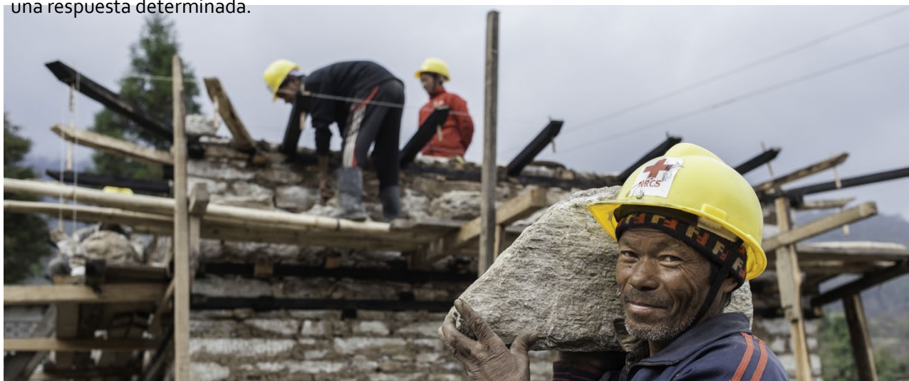
Trabajadores de la construcción construyen una casa modelo en la aldea de Suspa Chhemawati, en la región de Dolakha en Nepal.

Para los actores de los refugios y los asentamientos, cualquier revisión de las posibles modalidades de respuesta debe incluir un análisis de la capacidad de estos mercados críticos para apoyar la demanda de una respuesta determinada.