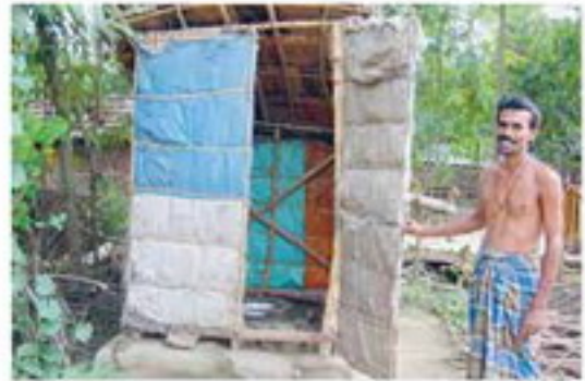
ਇਸਦੇ ਅਗਲੇ ਵਾਲੀ ਨਾਲ ਫੁੱਲੀ ਜਾਂ ਹੋਰ ਸਿੱਕੇ ਪਿੱਛਕੇ ਵੱਖ ਹੋ ਸਕਦੇ ਹਨ।