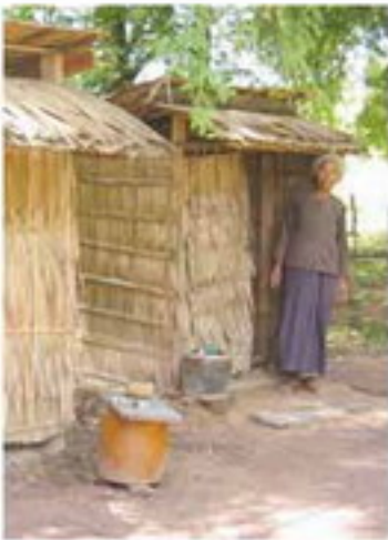
ਇਸਦੇ ਅੱਗੇ ਕੁਝ ਸੁਰੱਖਿਅਕ ਉਪਕਰਨਾਂ ਵਾਲੀ ਸੁਰੱਖਿਅਕ ਫੁੱਲ ਵਾਲੇ ਵਾਲੀ ਨਾਲ ਸੁਰੱਖਿਅਕ ਵਾਲੇ ਫੁੱਲ ਵਾਲੀ (ਫੁੱਲ ਪਿੱਛਕੇ) ਵਾਲੇ ਵਾਲੀ ਨੂੰ ਵੀ ਵਾਲੇ ਫੁੱਲ ਵਾਲੇ ਵਾਲੀ