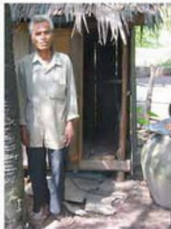
ਇਸਦੇ ਵਾਲੀ ਨਾਲ ਵਾਲੇ ਵਾਲੇ ਵਾਲੀ ਵਾਲੀ ਵਾਲੀ ਵਾਲੀ ਵਾਲੇ ਵਾਲੇ ਵਾਲੇ ਵਾਲੇ ਵਾਲੀ